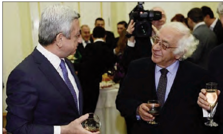
Նախագահ Սերժ Սարգսեան եւ «Ազգ»ի խմբագիր Յակոբ Աւետիքեան

«Դուք ապացուցում էք, որ հայրենասիրութեան դրսևորումները մասնագի- տութիւն չեն ճանաչում: Հավատացէ՛ք, սրանով դուք մեծ բան էք անում մեր երկրի յետագայ ընթացքի համար, մեր որդեգրած ար-