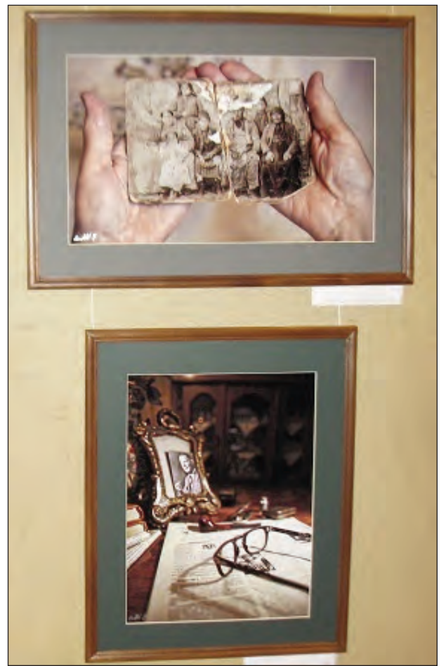
խուսական մրցանակ՝ - Բերտա Մարտիրոսեան /լուսանկար՝ «Անա- նուն դիմանկար»/ Միւս բոլոր հեղինակներին տրուեցին շնորհա- կալագրեր ցուցահանդեսին մասնակցութիւն ունենալու համար: