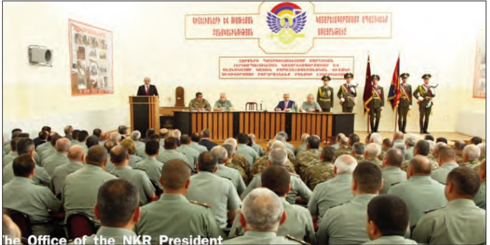
the Office of the NKR President

Նախագահ Բակո Սահակեան Յունիս 15-ին ստորագրած է հրամանագիր, որուն համաձայն՝ զօրավար-հարիւրապետ Մովսէս Յակոբեանը ազատ կացուցուած է Լեռնային Ղարաբաղի Հանրապետութեան պաշտպանութեան նախարար-պաշտպանութեան բանակի հրամանատարի պաշտօնէն: