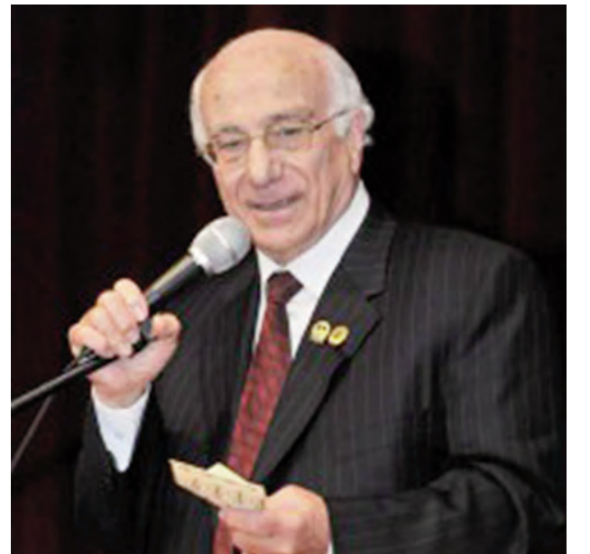
Հ.Բ.Ը.Մ. Կեդրոնական Վարչական Ժողովի երկարամեայ նախկին անդամ եւ փոխ-նախագահ մինչեւ 2010, այժմ Կ.Վ.Ժ.-ի վաստակաւոր (Emeritus) անդամ: Ռ.Ա.Կ. Կեդրոնական Վարչութեան երկարամեայ նախկին անդամ եւ Ատենապետ մինչեւ 1995: Գանատայի Հայաստանեայց Առաքելական Եկեղեցւոյ Թեմի հիմնադիրներէն եւ Թեմական Խորհուրդի անդրանիկ Ատենապետ, ապա հռչակուած Պատուոյ Ատենապետ: Ամերիկայի եւ Գանատայի Թ.Մ. Միութեան Կեդրոնական Վարչութեան հիմնադիր անդամ: Մոնթրէալի Թ.Մ. Միութեան հիմնադիրներէն, Ատենապետ այժմ Պատուոյ Նախագահ: Մոնթրէալի Ալեք Մաւուկեան Վարժարանի Հիմնադիր եւ Գործադիր Նախագահ մինչեւ 2011:

Չորս տարեկան հասակիս մայրս ինձ տեղաւորեց Աղէքսանտրիոյ Հայկազեան Կրթարան դպրոցը ուր յաճախեցի մինչեւ աւարտական