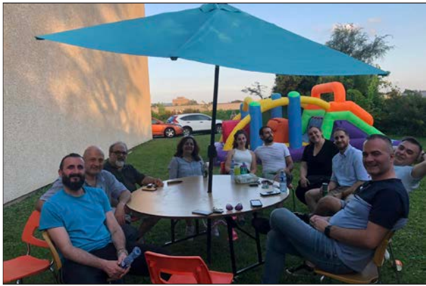
Կիրակի, 3 Սեպտեմբեր 2023: Կ. Ե. Ժամը 2:00 Զարդարուած Թեքէեան Մշակութային Միութեան պուրակը կը վայելէր բազմաթիւ ներկաներու զուարթ ու բարձր տրամադրութիւնը:

Խորովածի հոտը կը բուրբեր ու կը սրեր բոլորին ախորժը: