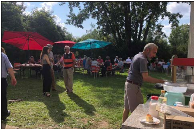
Ժրաջան վարչական անդամները, մեղուանման արագութեամբ ու կարգապահութեամբ կը սպասարկէին ճաշերը:

Արեւը իր վերջին շողշողուն ճաճանչները կը սփռէր Թեքէեան Մշակութային Միութեան պուրակի թարմ ու կանաչ տարածութեան վրայ... տալով իր «Մնացէ՛ք բարով» ի հրաժեշտը՝ ներկաներուն, որոնց ուրախութիւնն ու գնահատանքը կը զգենուր վառ ու կայտառ գոյներ: