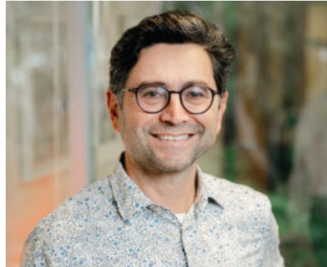
Prof. Ardem Patapoutian

We are both Armenians born in Beirut who met some 50 years ago in kindergarten. We grew up in war-torn Lebanon, embedded in a bubble of Armenian language, school, and culture. We immigrated to the West (the United States and Switzerland), built careers as a scientist and a lecturer/columnist, and managed to stay in touch. The last time we saw each other was last summer in Armenia. We fondly remember sitting together in a loud jazz club in Yerevan, Armenia's capital, entertained by the proprietor who presented us with a 15-year-old Armenian brandy from Nagorno-Karabakh, a disputed enclave to the east of Armenia mainly populated by Armenians. We were there because the government of Armenia was celebrating