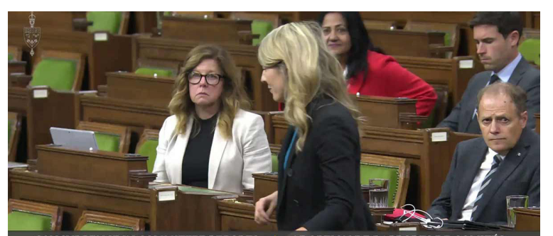
CONCURRENCE IN COMMITTEE REPORTS | ADOPTION DE RAPPORTS DE COMITÉS

Գանատայի արտաքին գործոց նախարար Մելանի Ժոլի Գանատայի խորհրդարանին մէջ Արցախի մէջ ստեղծուած կացութեան հարցով լսումներու ընթացքին չէ բացառած Ատրպէյճանի դէմ պատժամիջոցներ կիրարկելու կարելիութիւնը: