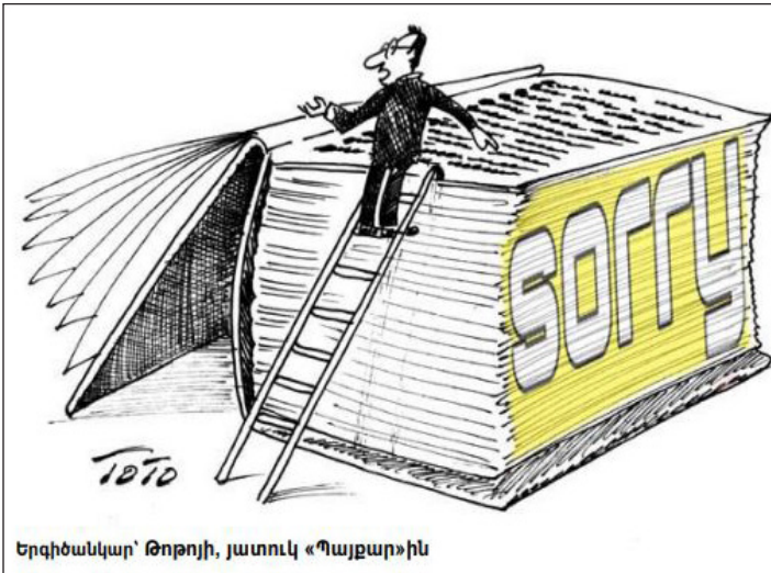
Երգիծանկար՝ Թորոյի, յատուկ «Պայքար»-ին

Այդ երկիրներու շարքին անակնկալօրէն յայտնուեցաւ նաեւ Հոլանտան, Եւրոպայի ամենահարուստ ու բարգաւաճ, այսպէս կոչուած՝ «Ոսկեայ դարաշրջան» տեսած երկիրը: Կը պարզուի, որ 17-19-րդ դարերուն այս երկիրը անելի քան 600.000 ափրիկեան ստրուկներ գերեվարելու եւ վաճառելու է «Նոր աշխարհ» Ամերիկա, եւ կը համարուի մարդկային առուծախի (trafficking) ախոյեան, իսկ ներկայիս կը պատրաստուի, ինչպէս անցեալ շաբաթ Լա Չեյի մէջ դէպի հոլանտական նախկին գաղթավայր