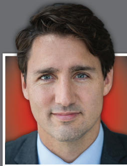
TRÈS HON. JUSTIN TRUDEAU