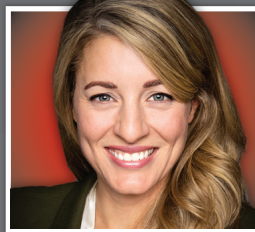
HON. MÉLANIE JOLY

Anthony.Housefather@parl.gc.ca (514) 283-0171