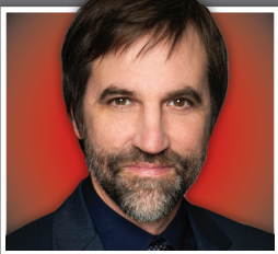
HON. STEVEN GUILBEAULT

Faycal.El-Khoury@parl.gc.ca (450) 689-4594